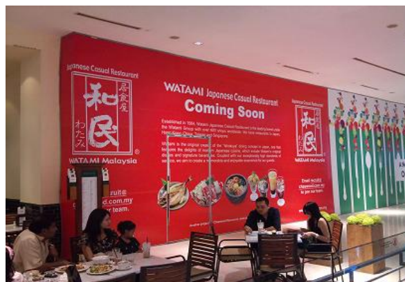
「パビリオン」4F、店頭でのオープン告知（建設中）