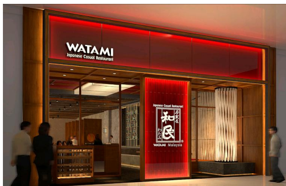
パースイメージ 「店舗入り口付近」