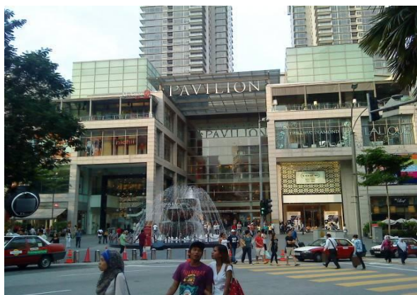
1号店出店予定のショッピングモール「パビリオン」

ワタミ・インターナショナル株式会社は香港に2008年11月設立、海外グループ事業会社の管理・統括、海外の新地域開発、海外のフランチャイズ本部として海外事業を推進・統括する会社であります。今後は2012年度末までに100店舗体制（7月末現在49店舗）へ向け店舗展開を加速化させ、また、アジアを中心に1年ごとに新しい地域を開発していきます。